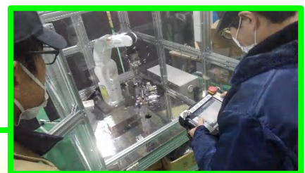
◇産業用ロボット コースの研修風景